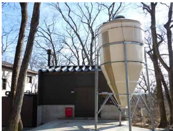
(山水閣:ペレットボイラー施設)