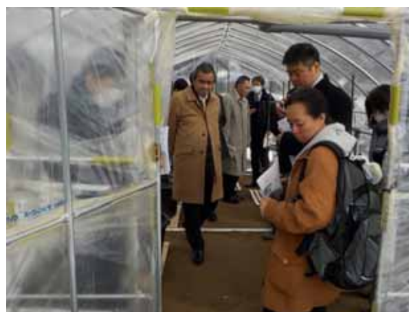
(ホテルサンバレー:温泉熱利用ビニールハウス見学)