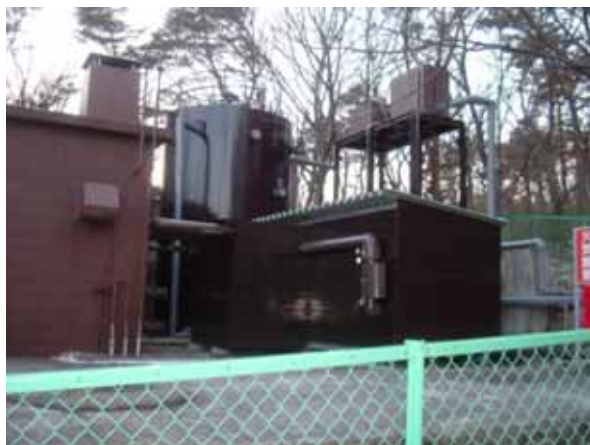
(新那須温泉供給:ヒートポンプ施設)