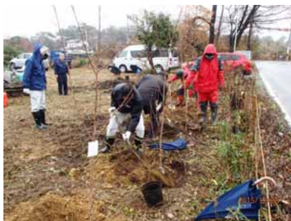
(木質バイオマス熱利用セミナー植林体験)