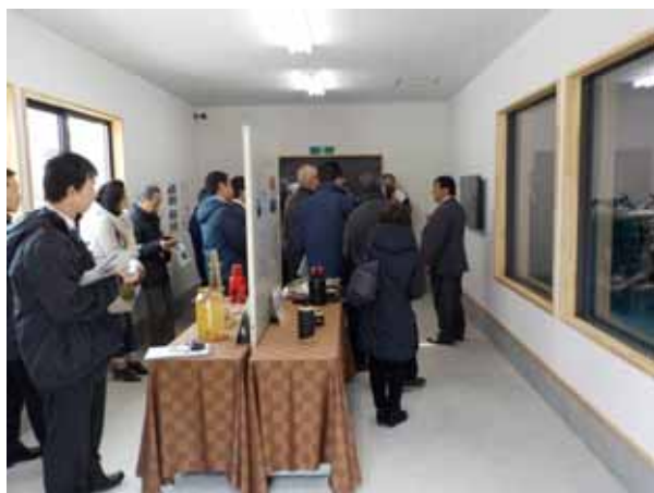
(ホテルサンバレー:温泉熱発電所見学)