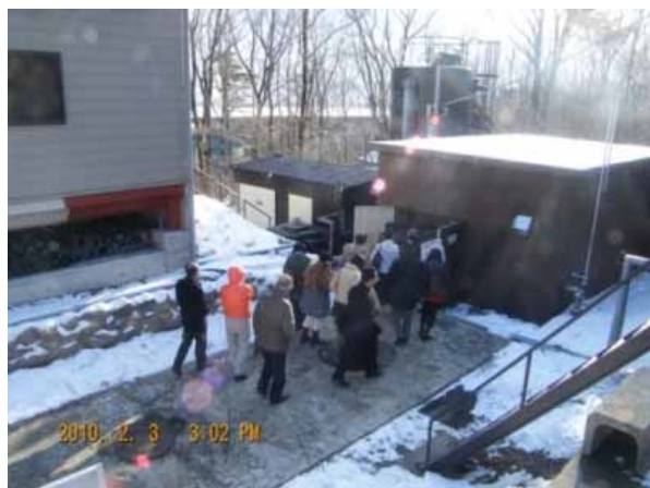
(新那須温泉供給:ヒートポンプ施設見学)