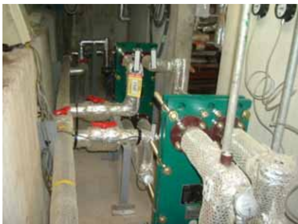
(ホテルビューパレス:熱交換器)