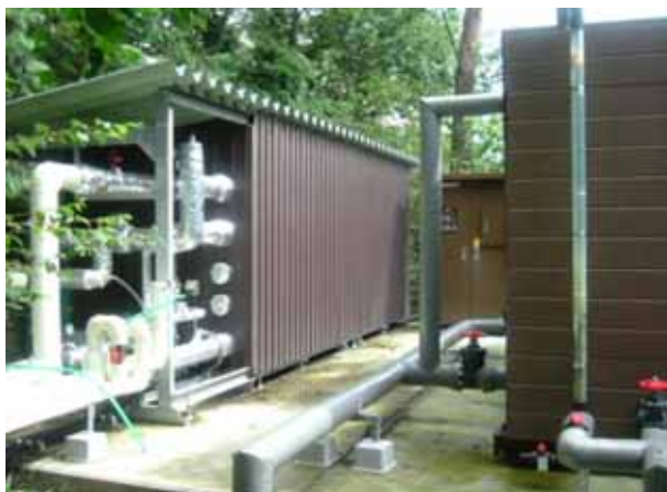
(ホテルサンバレー:ヒートポンプ施設)